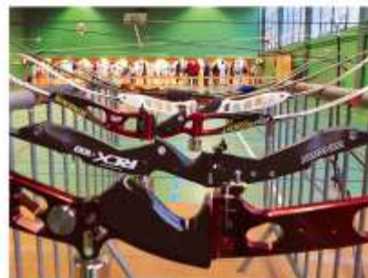
Quelques vues des arcs et des cibles :

Les résultats sont donnés par catégorie d'âge, de sexe et par type d'arc, qui sont l'arc classique, l'arc à poulies et l'arc nu.