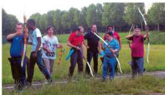
La journée du 20 juin, également à 600m un temps par vent