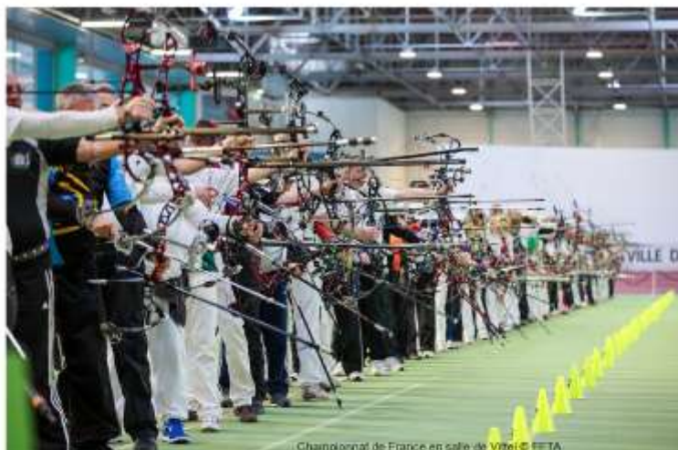
Championnat de France en salle de Vittel