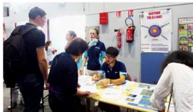
Le stand du Club de Tir à l'Arc à la Broc'Sport le dimanche 9 septembre 2018 au Palais des Sports de Créteil.

Article extrait du journal « CONTACTS US » n°101 d'octobre 2018.