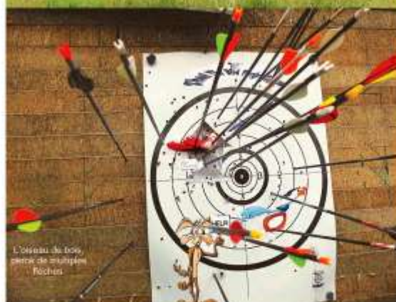
L'oiseau du bois, perché de multiples flèches