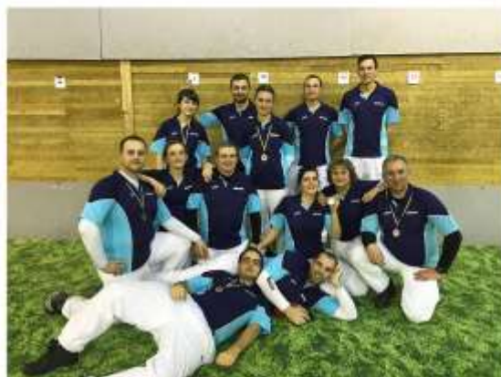
Les participants au championnat départemental.

De plus l'équipe des arcs classiques termine sur la deuxième marche du podium et les deux équipes arcs à poulies engagées s'octroient les places deux et trois sur le podium.