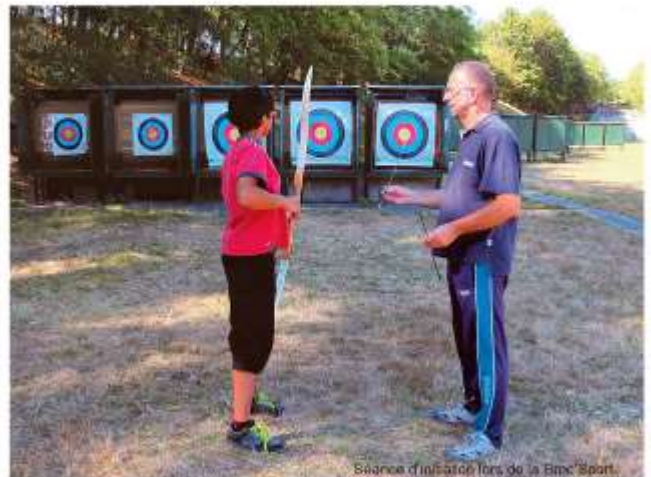
Session d'initiation lors de la Broc'Sport

Correspondant : Maurice MONTORO © US Créteil Tir à l'Arc.