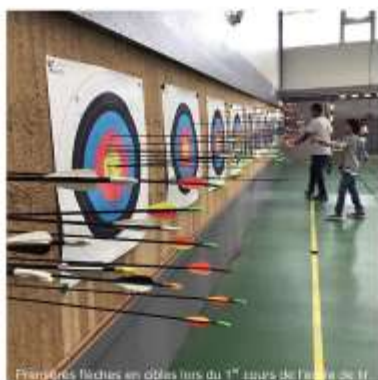
Préparation des cibles lors du 1 er tour de l'Abat Oiseau.

L'heure de la rentrée a désormais sonné. Et à cette occasion, nous souhaitons remercier chaleureusement la mairie de Créteil pour son continuel soutien. En effet deux chantiers ont été réalisés cet été avec l'association du service des sports et des services techniques de la ville. Le premier chantier s'est déroulé sur notre terrain extérieur avec le concours des menuisiers qui ont renové quasiment la moitié de nos cibles et ce malgré la canicule ! Quant au second, c'est au gymnase du Jeu de Paume qu'il a eu lieu où d'importants travaux de peinture ont été réalisés. De plus, il est déjà prévu de nouvelles améliorations pour la fin de l'année avec des travaux d'insonorisation et d'éclairage. Alors encore une fois, merci de nous permettre de pratiquer notre sport dans les meilleures conditions possibles.