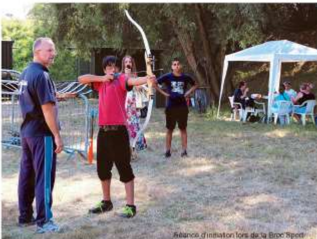
Session d'initiation lors de la Broc'Sport

Correspondant : Maurice MONTORO © US Créteil Tir à l'Arc.