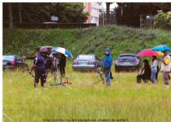
Une journée où les participants étaient au soleil !

Correspondant Maurice MONTORO Photographies : US Créteil Tir à l'arc.