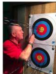
Vérification par l'arbitre.