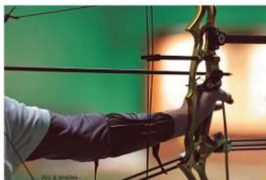
Arç à poulies

Correspondant Nicolas BERBY, Photographes USC Créteil Tir à l'Arc et Jean Masingue.